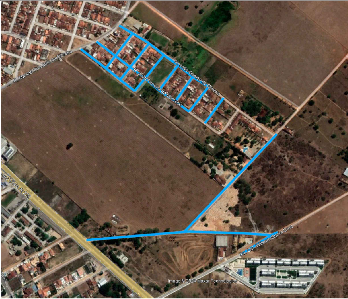
CROQUI DE LOCALIZAÇÃO sem escala